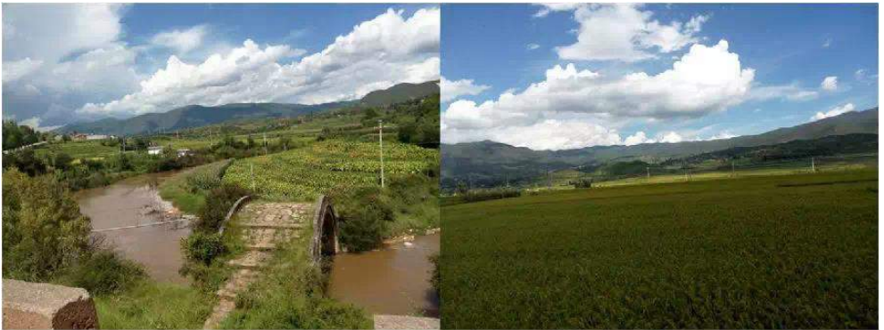
黑惠江两岸丰茂的农作物

而上述这一切的美好，都将可能因为下面这个硫酸厂而毁于一旦，剑川在全国大力发展旅游的前夜，可能因此而被毁坏于萌芽。本以为剑川的发展将迎来新的春天，这个古老而优秀的地区将焕发新的生机，而这一切也将因为这个硫酸厂而黯然无光。