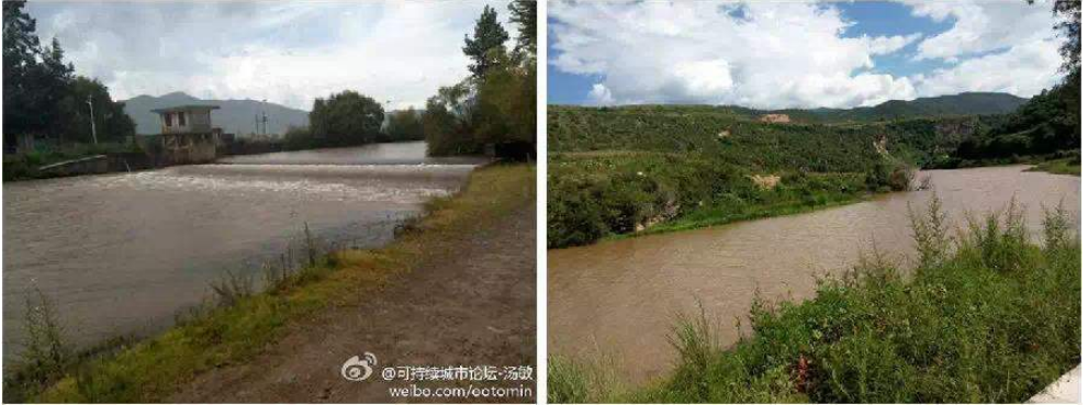
活力滋养的黑惠江