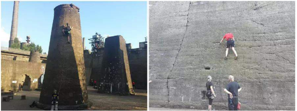
成功改造为旅游景区的鲁尔燃气厂

鉴于硫酸厂的主体建设已成既定事实，拆除也将造成一定的浪费，这对于这个优美且经济落后的剑川，无疑是一件不小的负担。通过国际优秀案例的经验，这些大体量的工业建筑可以更换功能，变成工业旅游地，这在德国的鲁尔地区，以及国内大多数工业建筑中，已得到良好的验证。我们也相信，现有的硫酸厂建筑，可以变成另外一处旅游地，并成为警示后人的环境教育基地。