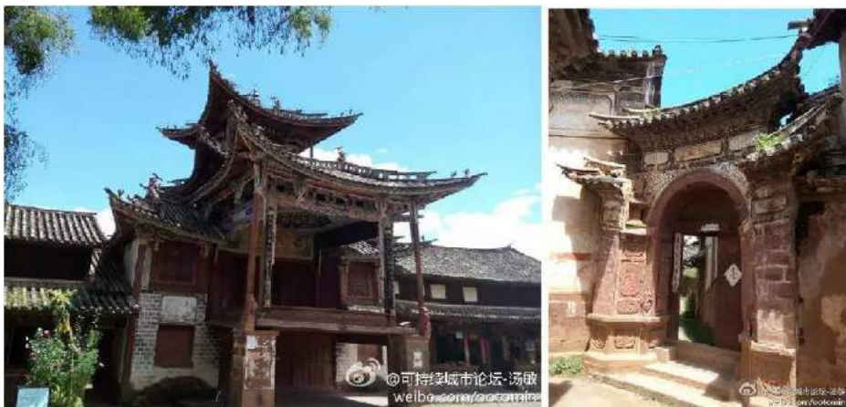
世界建筑文化遗产——沙溪古镇

包括沙溪古镇在内，剑川旅游拥有两处世界级、六处国家级资源，这样密集的优质资源在全国也属罕见，尤其以剑川独特的民族风俗和精湛的雕刻艺术广为流传。