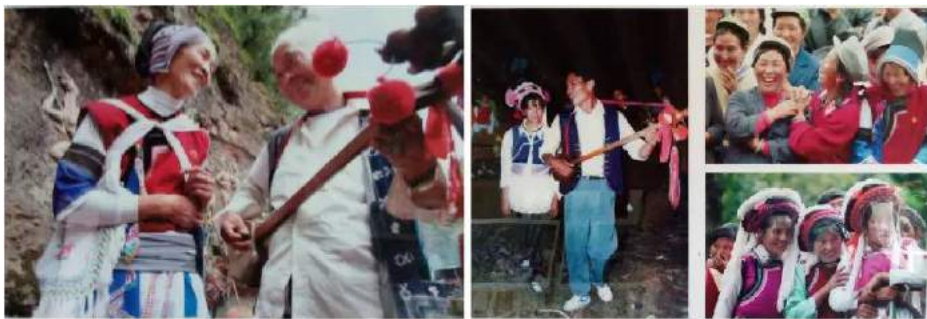
国家非物质文化遗产——石宝山歌会