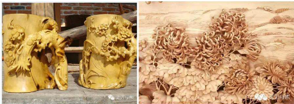
木匠之乡——剑川木雕

同样，剑川的木雕也是天下一绝，剑川县素称“木匠之乡”，木工艺人擅长雕刻各种人物、花鸟、山水及龙凤吉祥如意等图案，用以装饰门窗、家具等木雕工艺品中，尤其是云木雕花镶嵌在大理石家具，用优质硬木精心雕出龙、凤、狮、孔雀、梅花灯传统图案，制成桌、椅、茶几等，再镶嵌上苍山特产的彩花大理石，显得古朴大方新颖高雅，富于民族特色，即实用，又华美，远销欧、美等数十个国家和地区。