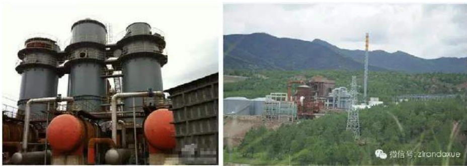
位于黑惠江旁的硫酸厂

硫酸厂是高污染和高风险的重大环境工程，在诸多环境评估疑点和论证不足的情况下匆匆上马，引起了大理以及全国众多环保、旅游人士的强烈质疑，通过各种渠道深度干预到硫酸厂的建设与投产。下面笔者梳理出五个疑问，质问剑川政府，望给出正面回应。