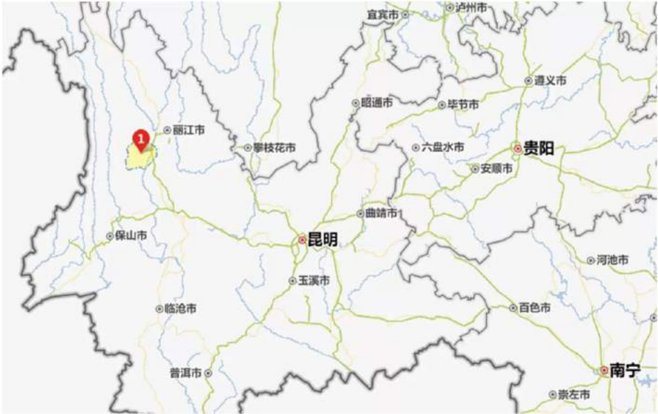
1 处为云南边陲县城剑川

如果把石宝山理解为向父亲一样培育了剑川的厚重与博大，创造优秀的民族传统和艺术品格，那黑惠江就像母亲一样滋润着剑川乃至整个流域，直至流出中国境内。