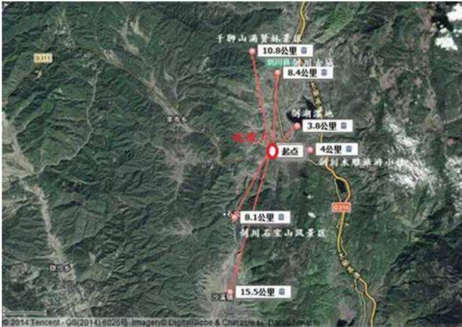
硫酸厂处于剑川珍贵资源的中心

2012年，剑川县重点投资项目年产20万吨硫精砂制酸装置建设项目，在黑惠江上游悄然建设，如今高高的烟囱和大罐等主体建设已基本完成，并预计今年年底投入使用。如上图所示，硫酸厂位于剑川重要旅游资源的中心地点，周边分布着千狮山、剑湖、石宝山、沙溪古镇等重要世界级的珍贵资源。尤其硫酸厂坐落于黑惠江上游，直接威胁着石宝山和沙溪古镇的水源安全。